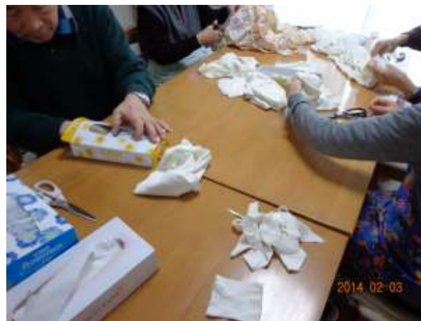
ボランティア活動